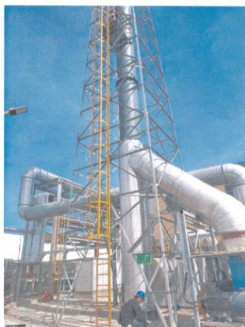
RTO 排气筒出口 06#