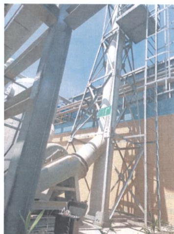
污水处理站排气筒出口 07#