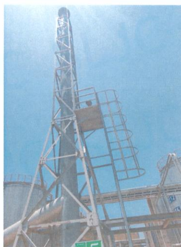
罐区一排气筒出口 05#